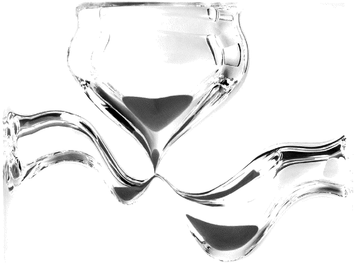
VARIATIONS OF TIME BY NENDO

E 8,00 "Italy only" - F E 13,00 - D E 13,00 - GR E 14,20 - P 15,40 - EE 8,90 - GB GBP 11,00 - BE 10,00 - SKR 170,00 - CH SFR 23,00 - NL E 19,00 - A E 10,00 - N NKR 172,00 -